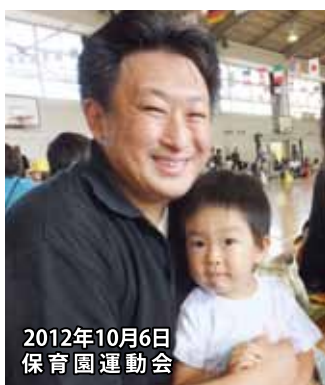
2012年10月6日 保育園運動会

「街づくり」政策の中で 現在の70歳は、30年前と 比較して肉体的年齢が、11歳 若いと言われます。日本は 「平均寿命」「高齢者数 」「高齢化率」において 世界一の高齢化社会です。 超高齢社会「ユニティ 」のあり方を探り、併せて 子育て環境充実策も提案 して参ります。