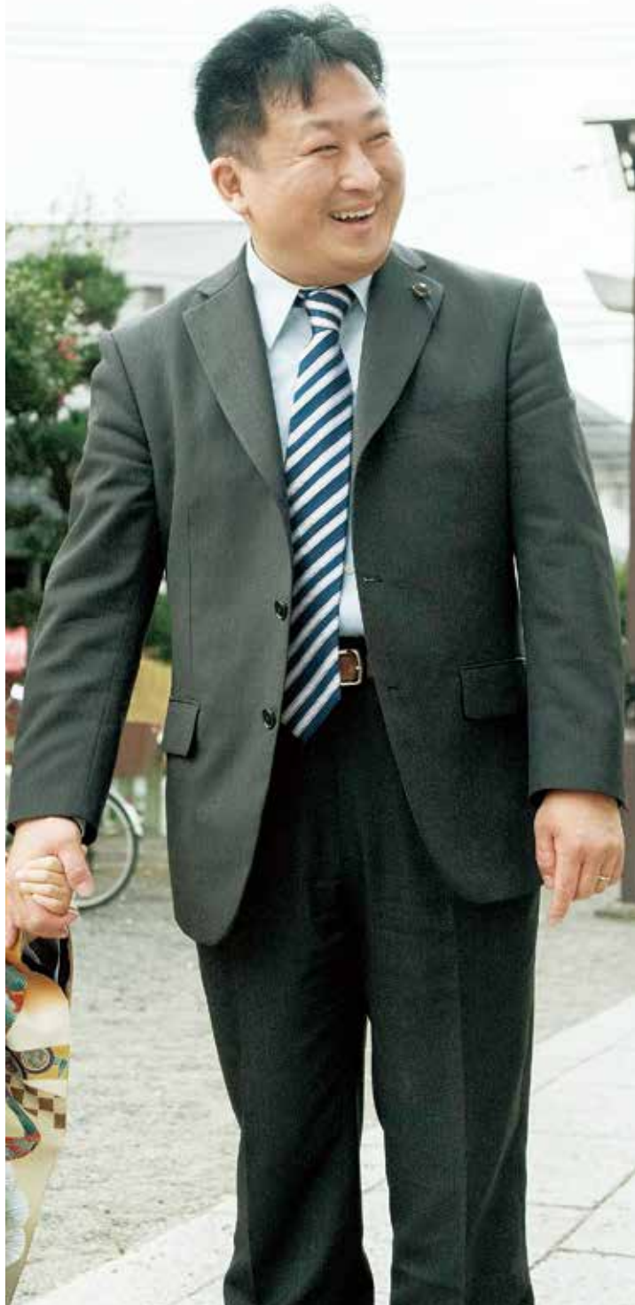
神奈川県議会議員 ともかず さとう知一