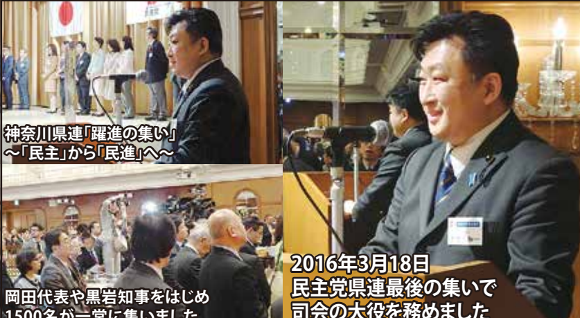
2016年3月18日 民主党県連最後の集いで 岡田代表や黒岩知事をはじめ 1500名が一堂に集いました